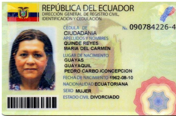
Cedula de la Supervisora Institucional