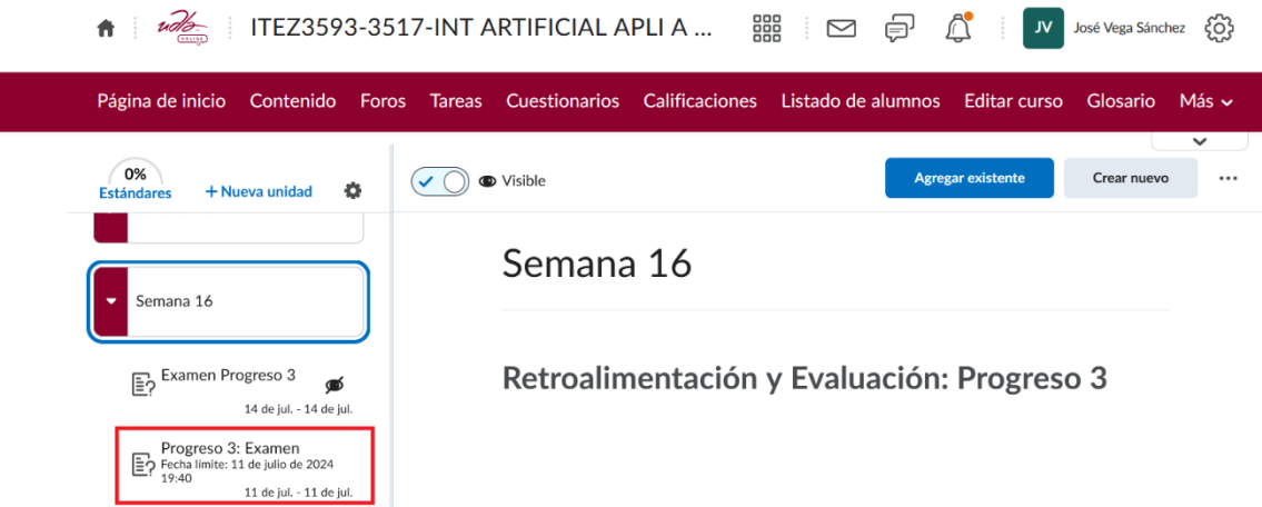
Figura 1. Programación del Examen

A continuación, las pruebas que el día 11/07/2024 se tomo el examen de Inteligencia artificial. En particular como se ve en la Figura 1, el examen fue programado para el día 11 de Julio de 2024.